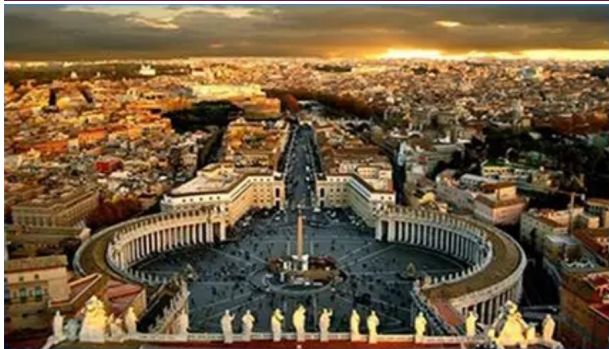
Lm. Timothy Radcliffe, O.P.