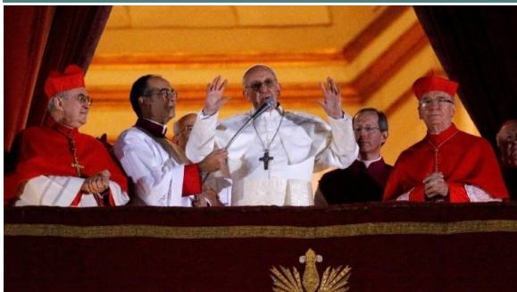
Thứ Năm, ngày 13/3/2025, đánh dấu 12 năm Giáo Hoàng của Đức Thánh Cha Phanxicô, Giáo Triều Roma, Giáo Phận Roma, cùng nhiều cá nhân và tổ chức đã gửi lời chúc mừng đến Đức Thánh Cha, cầu chúc Ngài mau bình phục.

Trong một bản tin, Ban Giám Đốc Viện Bảo Tàng và Di Sản Văn Hoá của Vatican, cùng tất cả các cộng tác viên bày tỏ vui mừng kỷ niệm 12 năm ngày Đức Thánh Cha Phanxicô được bầu chọn vào thừa tác vụ Phêrô. Lời chúc mừng được mở đầu bằng một đoạn trong lời chào đầu tiên của Đức Thánh Cha vào ngày 13/3/2013: “Chúng ta hãy luôn cầu nguyện cho chính chúng ta: cầu nguyện cho nhau. Chúng ta hãy cầu nguyện cho tất cả thế giới để thế giới có được một tình huynh đệ lớn lao”. Nhân dịp đặc biệt này, mọi người chúc mừng Đức Thánh Cha, chúc Ngài sớm bình phục. Toàn thể nhân viên của Viện Bảo Tàng Vatican cũng bày tỏ sự quý mến, gần gũi và cầu nguyện cho Đức Thánh Cha.