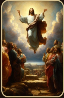
Tượng hiệu Đức Giêsu Kitô