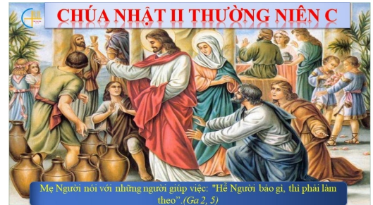
Mẹ Người nói với những người giúp việc: "Hè Người bảo gì, thì phải làm theo" (Ga 2, 5)

Trình thuật của Thánh Gioan làm nổi bật vai trò và sự tinh tế của Đức Trinh Nữ