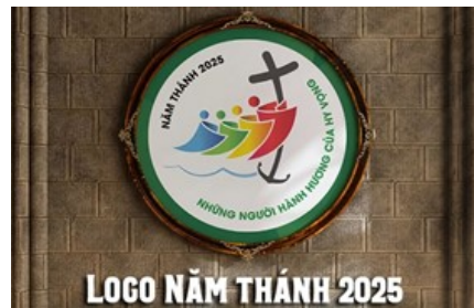
LOGO NĂM THÁNH 2025