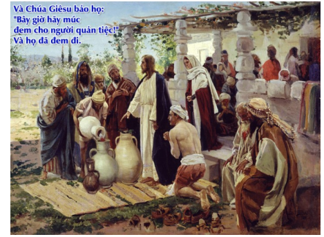
Và Chúa Giêsu bảo họ: "Bây giờ hãy múc đem cho người quản tiệc!" Và họ đã đem đi.