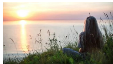
Bình an thực sự sẽ bắt đầu khi cuộc đời chúng ta hướng về Thiên Chúa. Anselm, Cisterciensien

Cuối cùng, để làm cho câu hỏi của tôi trở nên thực tế hơn, tôi đã hỏi những sinh viên hiện đang im lặng xem họ có thể làm gì để trải nghiệm được bình an, dù chỉ trong mười phút. Một sự im lặng đáng sợ bao trùm lớp học. Cuối cùng, một sinh viên dũng cảm đã thú nhận một cách khá thất vọng rằng với tất cả các bài tập mà cô ấy phải gánh và tất cả các deadline mà cô ấy phải đáp ứng, việc tìm kiếm sự bình an là điều không thể trong ít nhất vài tuần. Tôi nghĩ cô ấy đã nói thay cho nhiều người, nếu không nói là tất cả, những người bạn cùng lớp của cô ấy. Tôi nghĩ thật đáng buồn khi giáo dục chính quy lại là một sự gián đoạn của bình an. Liệu các bạn