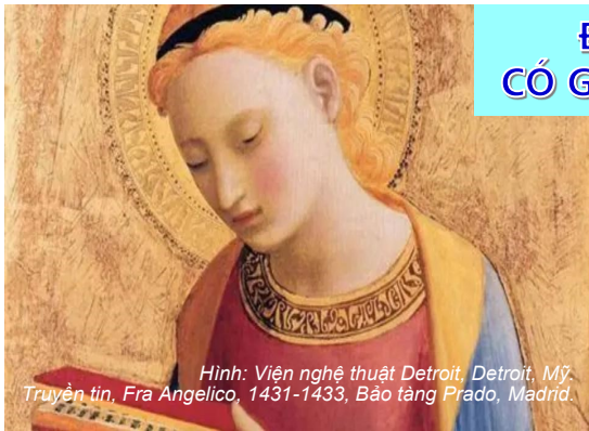
Hình: Viện nghệ thuật Detroit, Detroit, Mỹ. Truyền tin, Fra Angelico, 1431-1433, Bảo tàng Prado, Madrid.