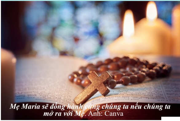
Mẹ Maria sẽ đồng hành cùng chúng ta nếu chúng ta mở ra với Mẹ.