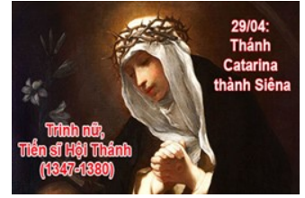
Thánh Nữ, Tiến sĩ Hội Thánh (1347-1380)

Ngoài những công tác bác ái xã hội, những ảnh hưởng mang tầm vóc chính trị, Thánh Catherine thành Siena còn quan tâm đến vận mạng của Hội Thánh trong cơn khủng hoảng ly giáo và chia rẽ.