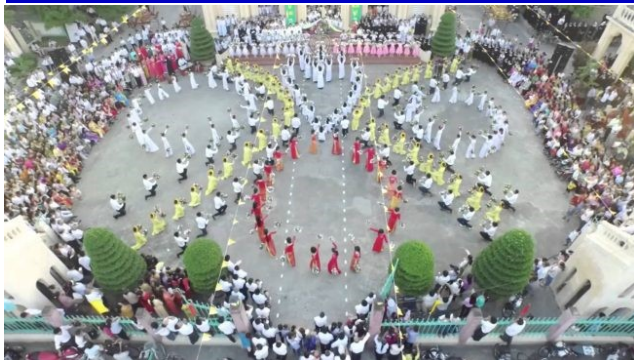
Hình chỉ mang tính cách minh họa

Gần đây dư luận bức xúc vì những biến tướng tiêu cực trong tôn giáo. Nguyên nhân sâu xa do đa số dân Việt đều nặng tâm linh, nhưng làm biếng và ngông nghênh chả chịu theo Đạo nào để truy tầm chân lý và xác tín niềm tin của mình.