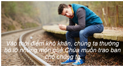
Vào thời điểm khó khăn, chúng ta thường bỏ lỡ những món quà Chúa muốn trao ban cho chúng ta

vì nhìn thấy quà tặng và ánh sáng cuối đường hầm, họ lại đắm chìm sâu hơn vào nỗi buồn, từ chối món quà mà Chúa tìm cách ban tặng cho họ, nhưng lại mở cửa cho kẻ thù tấn công vào những vết thương mà Chúa muốn chữa lành.