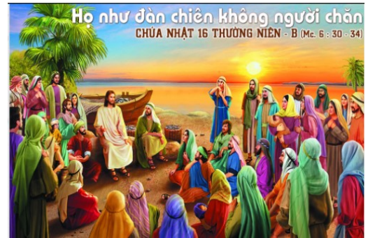
Ho như đàn chiên không người chăn CHÚA NHẬT 16 THƯỜNG NIÊN - B (Mc. 6 : 30 - 34)

Riêng trong lãnh vực tông đồ, cầu nguyện tuyệt đối cần thiết . Thật vậy, việc tông đồ bắt nguồn từ nơi Chúa. Làm việc tông đồ là làm việc của Chúa. Làm việc của Chúa mà không kết hiệp mật thiết với Chúa thì không những không thể có kết quả tốt đẹp mà còn có nguy cơ đi sai đường, làm hỏng công việc của Chúa. Không cầu nguyện ta sẽ dễ chú ý tới những hoạt động thuận tụy phô trương bề ngoài. Không cầu nguyện ta sẽ dễ biến việc của Chúa thành của riêng ta và vì thế sinh ra tự phụ, kiêu hãnh. Không cầu nguyện, việc tông đồ sẽ chỉ là một hoạt động xã hội