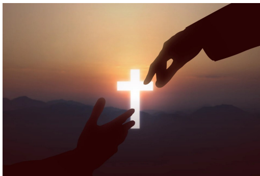
Tha thứ theo nhiều cách cũng giống như chịu đóng đinh.

Người dịch: Mai Ni Nguồn: Catholic Exchange