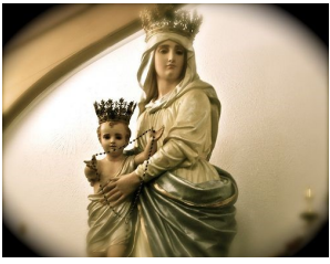
Đức Mẹ Chiến Thắng. Ảnh: Pinterest.com