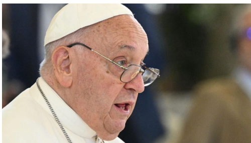
ĐTC phát biểu tại hội nghị