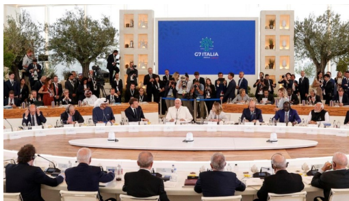
DTC Phanxicô tham dự hội nghị thượng đỉnh G7 về trí tuệ nhân tạo (ANSA) | Ảnh: Vatican Media