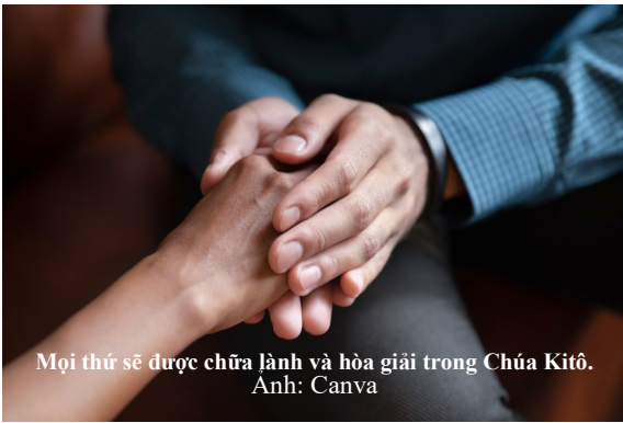
Mọi thứ sẽ được chữa lành và hòa giải trong Chúa Kitô.