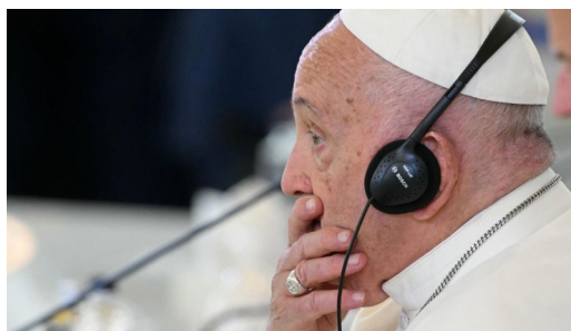
ĐTC lắng nghe các ý kiến khác tại hội nghị