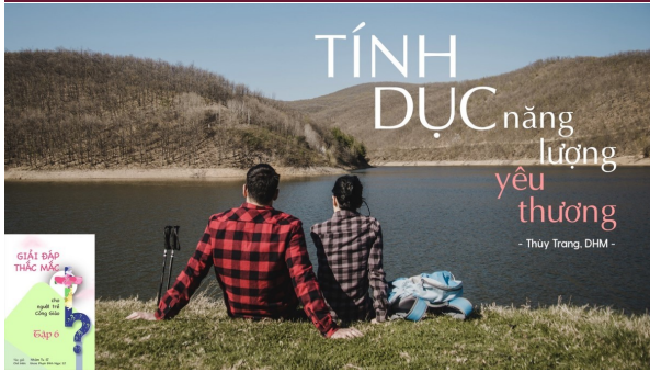
Thùy Trang – DHM