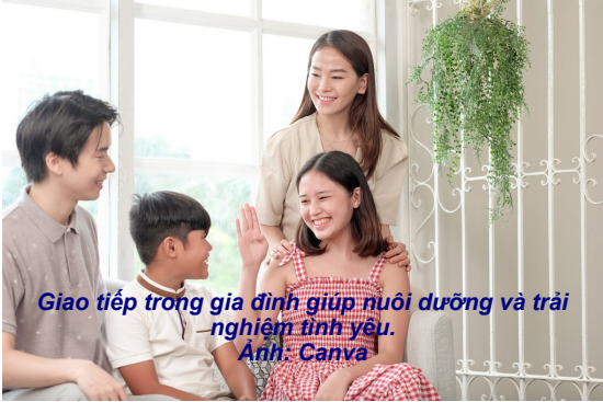
Giao tiếp trong gia đình giúp nuôi dưỡng và trải nghiệm tình yêu.

Nếu bạn đang dành thời gian bên nhau nhiều hơn bình thường, những gợi ý sau đây có thể hữu ích cho bạn.